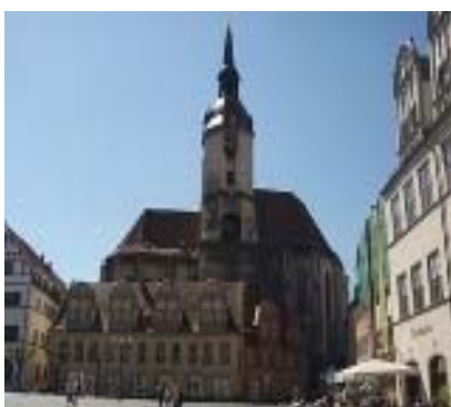
Marktplatz in Naumburg

Ein imposantes Landschaftsbild bietet sich schon gleich zu Beginn Ihrer heutigen Etappe. Wie eine großartige Gebirgslandschaft mit den hervorspringenden Wellenkalkbergen zeigt sich bald der imposante „ Saale-Canyon “.