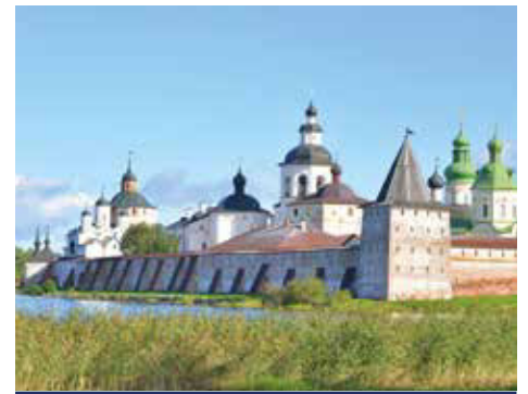
Das Kirillow Kloster ist eine der größten russischen Klosterfestungen