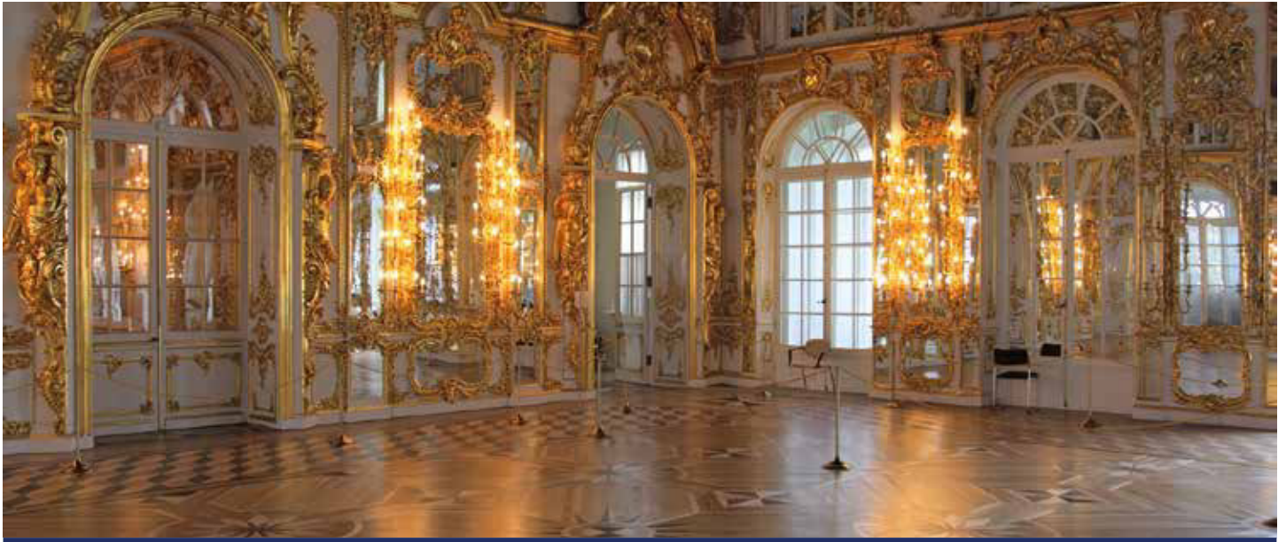
Der Katharinenpalast in Zarskoje Selo ist eine der schönsten Zarenresidenzen Russlands

Russland hautnah erleben, das können Sie auf dieser einzigartigen Reise. Moskau bildet den furiosen Anfang: Entdecken Sie mit dem 540 Meter hohen Ostankino-Turm das höchste Bauwerk Europas, spazieren Sie über die Große Steinerne Brücke bis zum prachtvollen Kremlpalast oder bestaunen Sie die unzähligen Kathedralen, deren Zwiebeltürme sich goldglänzend in den Maihimmel erheben. Ein Schatz reiht sich an den anderen, doch es zieht uns weiter – vorbei an stillen Klöstern, verwunschenen Inseln und pittoresken Dörfern. Da taucht St. Petersburg am Newa-Ufer auf: Prachtige Paläste, die weltberühmte Eremitage, der goldene Ballsaal von Schloss Peterhof – am besten gehen Sie selbst auf Schatzsuche.