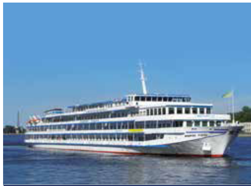
Mit der MS ANDREY RUBLEV sind Sie auf den schönsten Wasserstraßen Russlands unterwegs