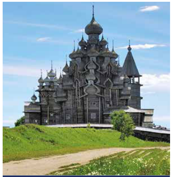
Die Insel Kishi ist der Ort mit den wohl bekanntesten denkmalgeschützten Holzhäusern Russlands

Alle Zeiten sind Richtzeiten. Programmänderungen, auch durch Hoch- und Niedrigwasser, oder Verzögerungen bei Schleusendurchfahrten sind vorbehalten. HT = Halbtagesausflug