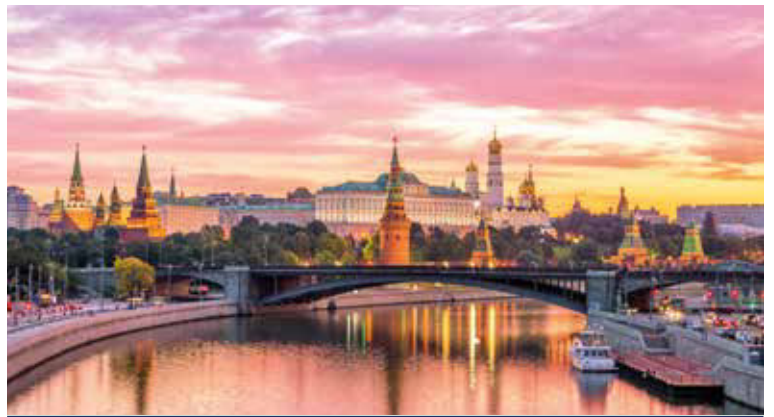
Der Moskauer Kreml ist der älteste Teil der russischen Hauptstadt Moskau und deren historischer Mittelpunkt

Russland hautnah erleben, das können Sie auf dieser einzigartigen Reise. Moskau bildet den furiosen Anfang: Entdecken Sie mit dem 540 Meter hohen Ostankino-Turm das höchste Bauwerk Europas, spazieren Sie über die Große Steinerne Brücke bis zum prachtvollen Kremlpalast oder bestaunen Sie die unzähligen Kathedralen, deren Zwiebeltürme sich goldglänzend in den Maihimmel erheben. Ein Schatz reiht sich an den anderen, doch es zieht uns weiter – vorbei an stillen Klöstern, verwunschenen Inseln und pittoresken Dörfern. Da taucht St. Petersburg am Newa-Ufer auf: Prachtige Paläste, die weltberühmte Eremitage, der goldene Ballsaal von Schloss Peterhof – am besten gehen Sie selbst auf Schatzsuche.