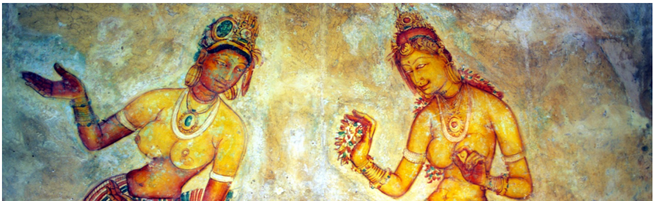
Die Wolkenmädchen von Sigiriya

Früh morgens Transfer zum Flughafen; Rückflug mit Emirates via Dubai nach Düsseldorf; Gegen Abend Ankunft